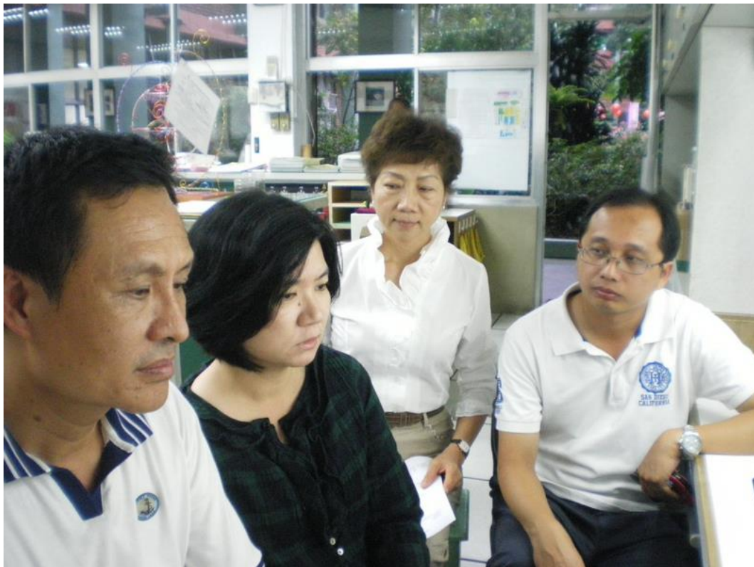
103年11月17日 照片說明：討論問題之解決方式