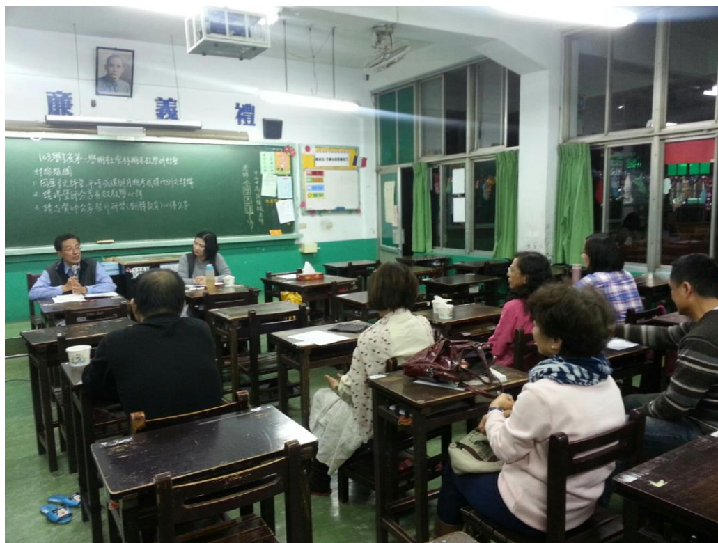
104年1月14日 照片說明：教務主任蒞臨指導