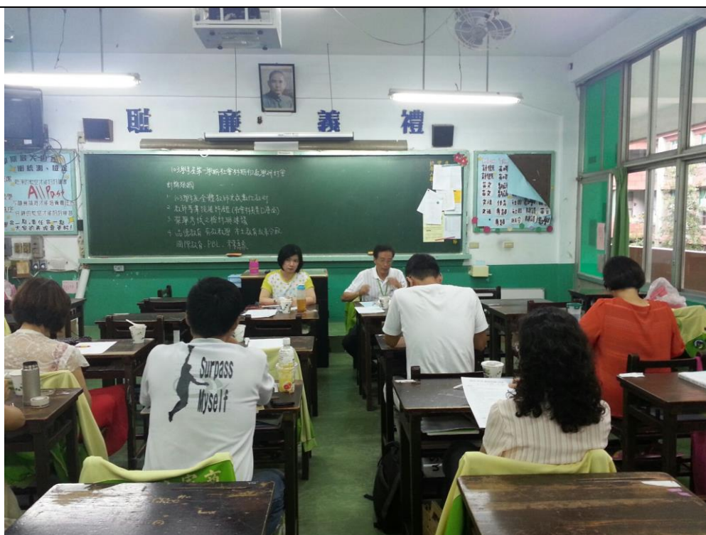
103年9月3日 照片說明： 教務主任蒞臨指導