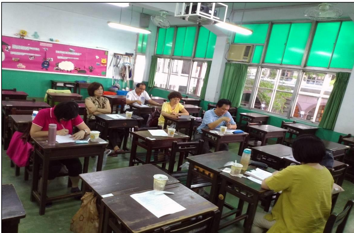
104年 6月 26日 照片說明：科主席主持研討會