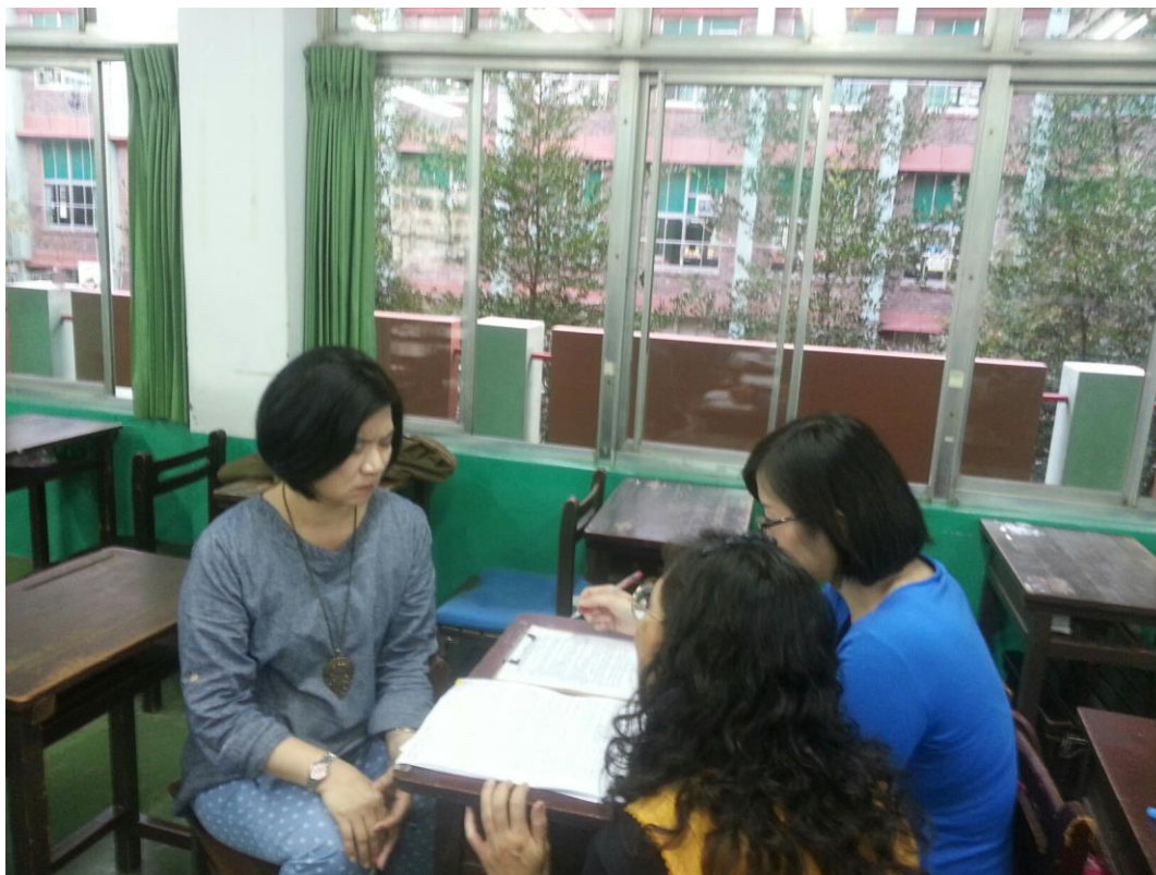
104年2月26日 照片說明：針對實施作業作討論