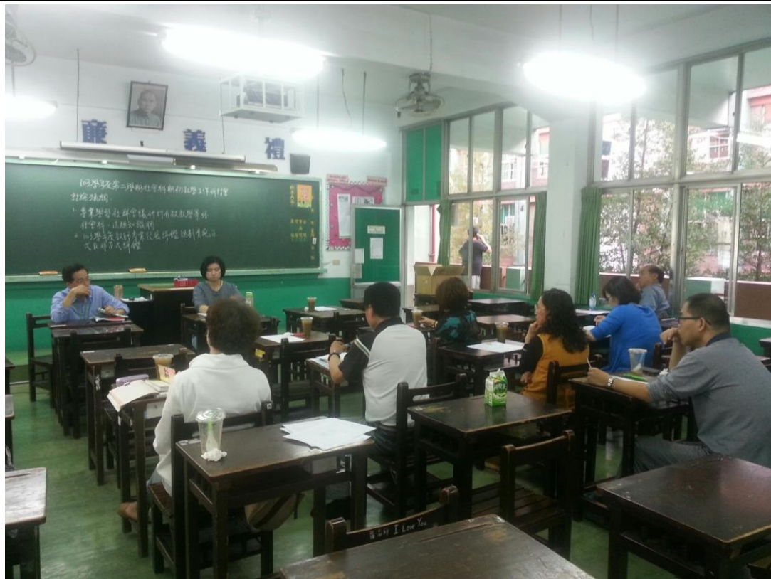
104年2月25日 照片說明：教務主任蒞臨指導