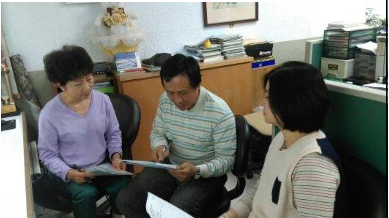
103年12月29日 照片說明：參與教師提供建議