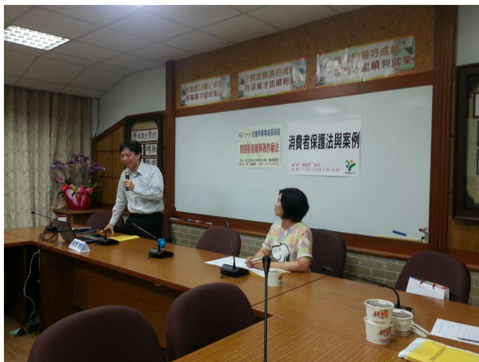
103年11月25日 照片說明：楊副教授針對今日主題進行講演