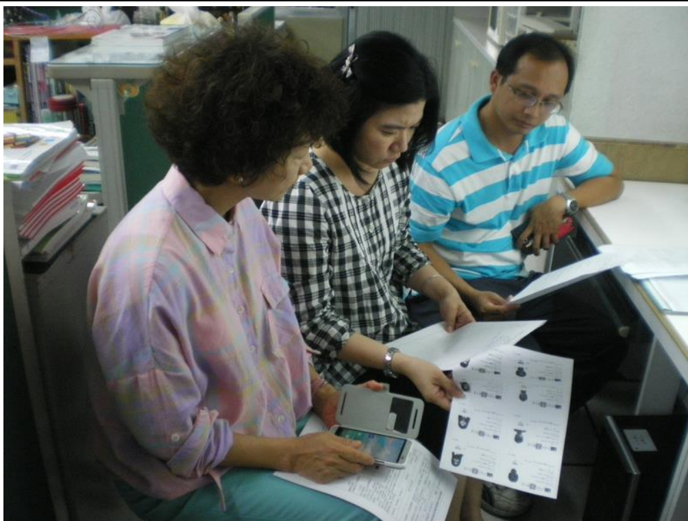
103年11月10日 照片說明：說明學生素質