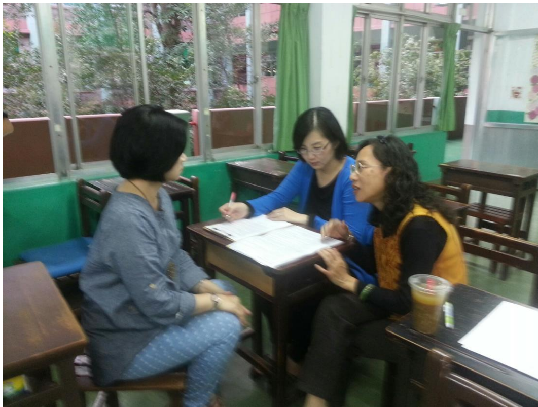
104年2月26日 照片說明：針對實施內容進行討論