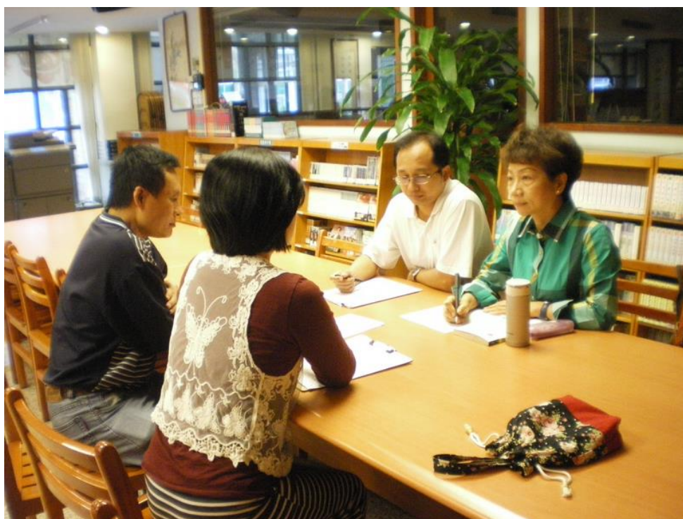
103年11月19日 照片說明：針對學習共同體內容討論