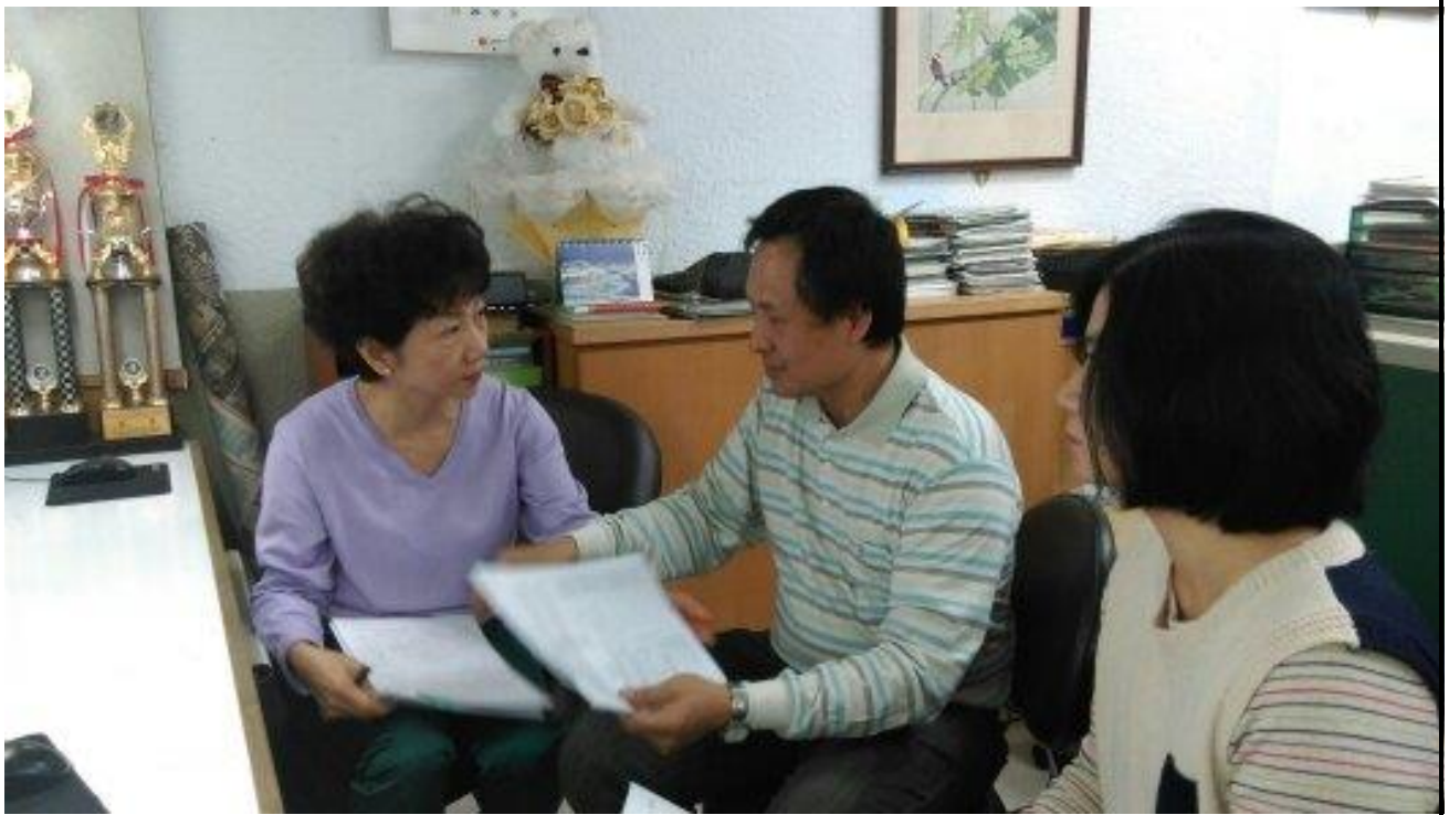
103年12月29日 照片說明：針對教學內容進行討論