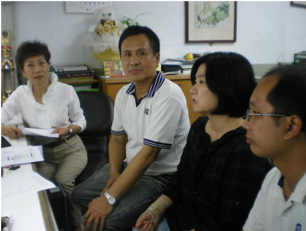
103年11月17日 照片說明：說明課程進行中之問題