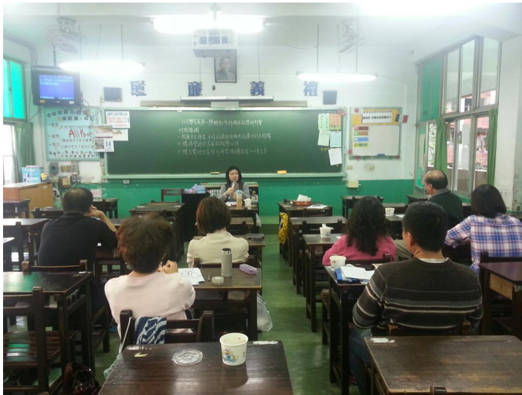
104年1月14日 照片說明：科主席主持會議