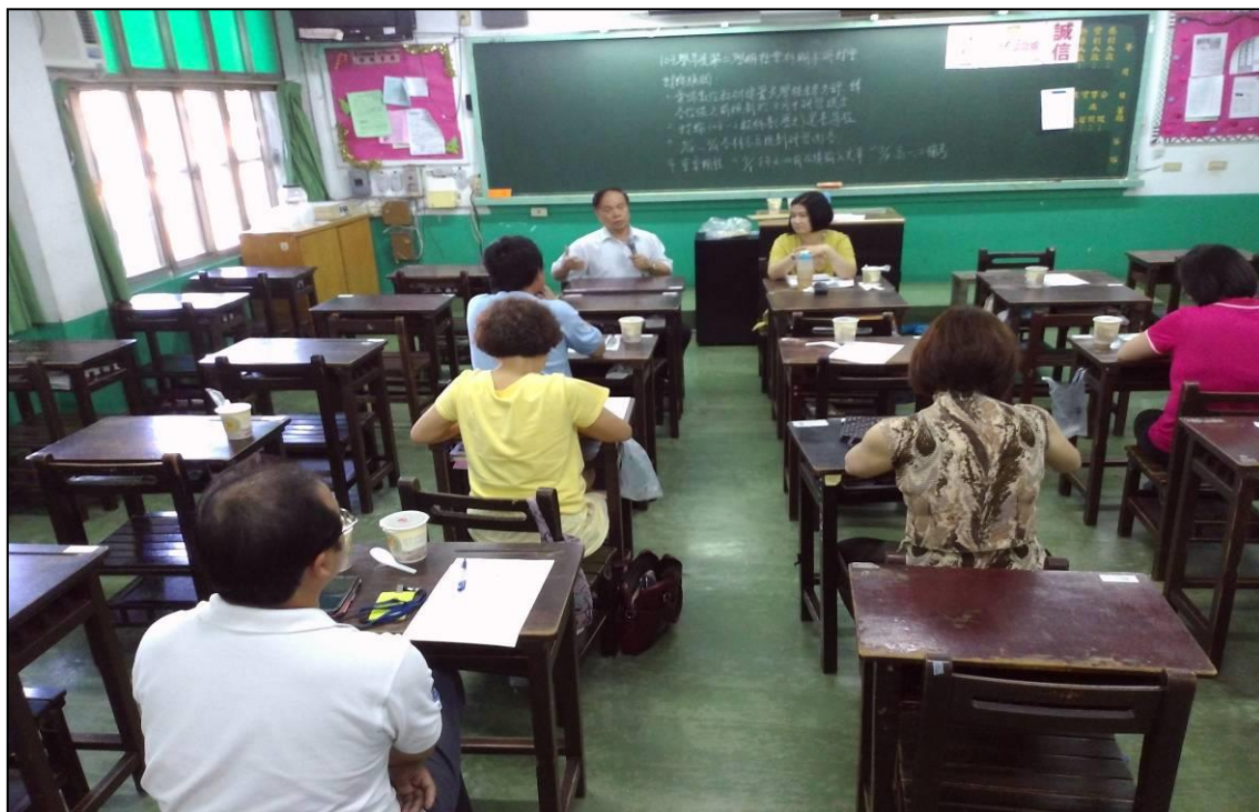
104年 6月 26日 照片說明：校長蒞臨指導