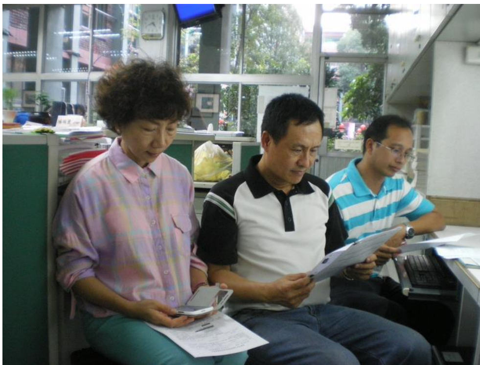
103年11月10日 照片說明：介紹課程內容