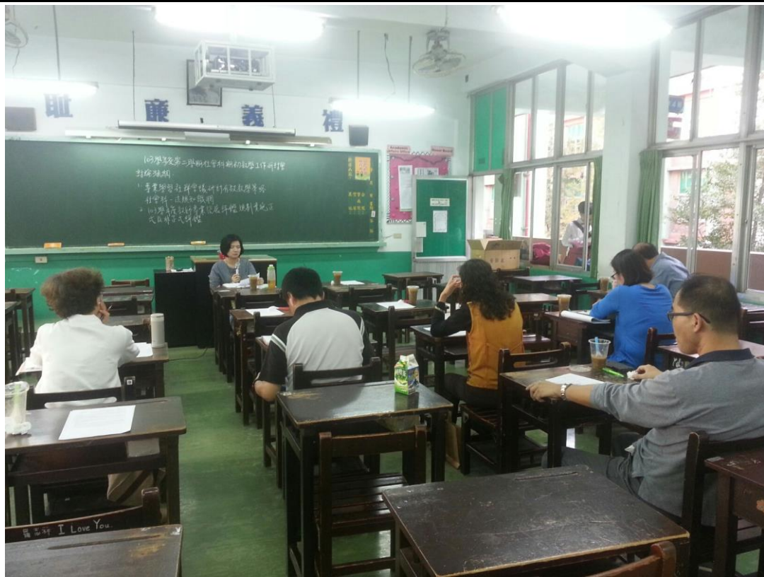
104年2月25日 照片說明：科主席主持會議