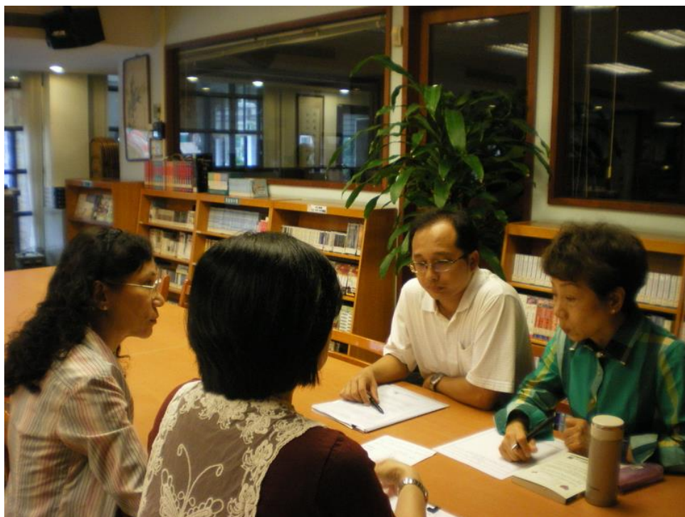
103年11月19日 照片說明：針對學習共同體內容討論