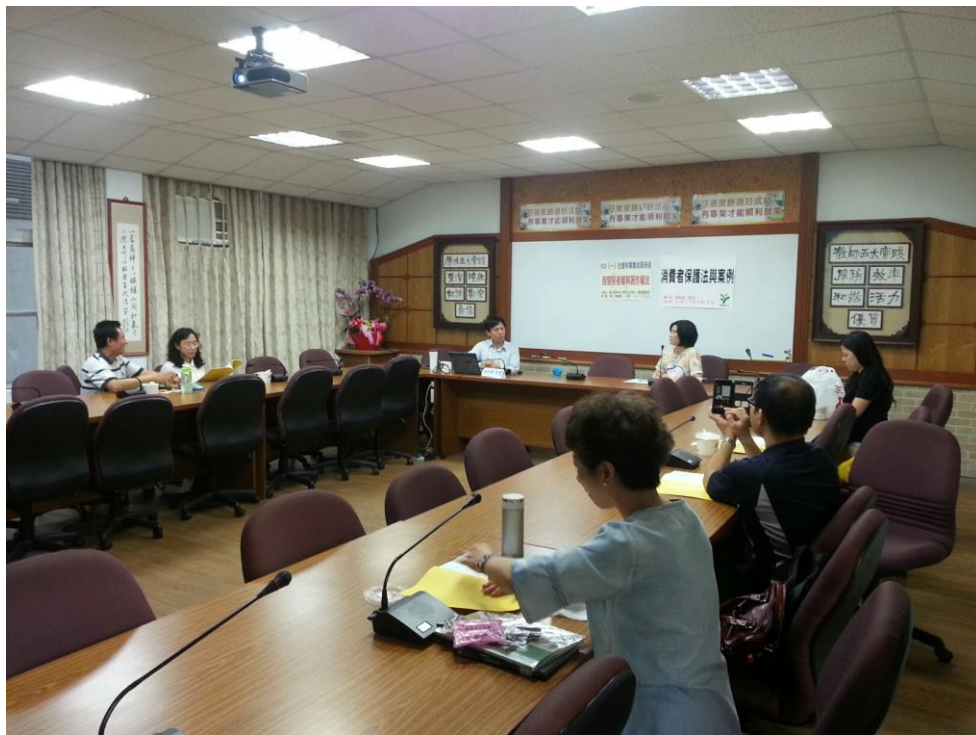
103年11月25日 照片說明：針對今日講演內容進行討論