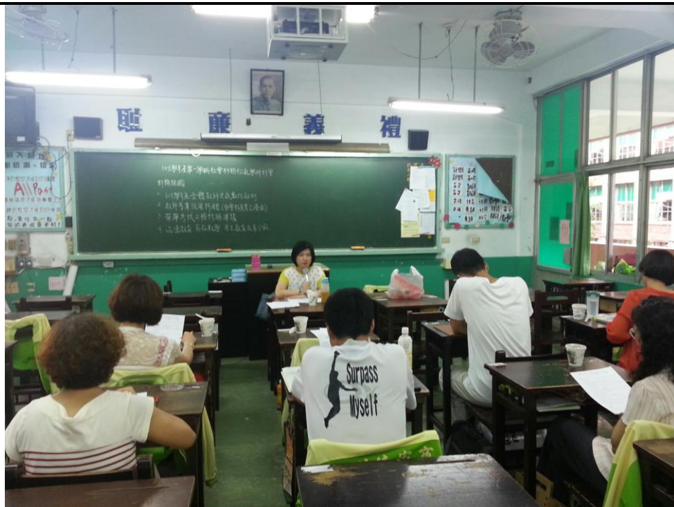
103年9月3日 照片說明： 主席報告事項