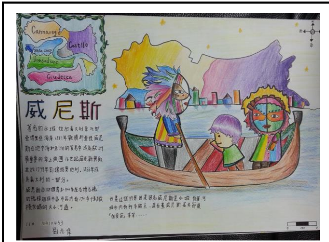
想像地圖：義大利威尼斯