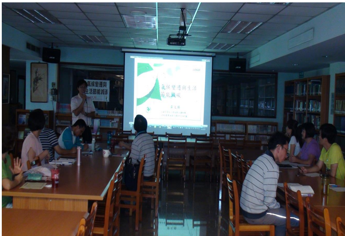
104年8月20日 照片說明：教授演講