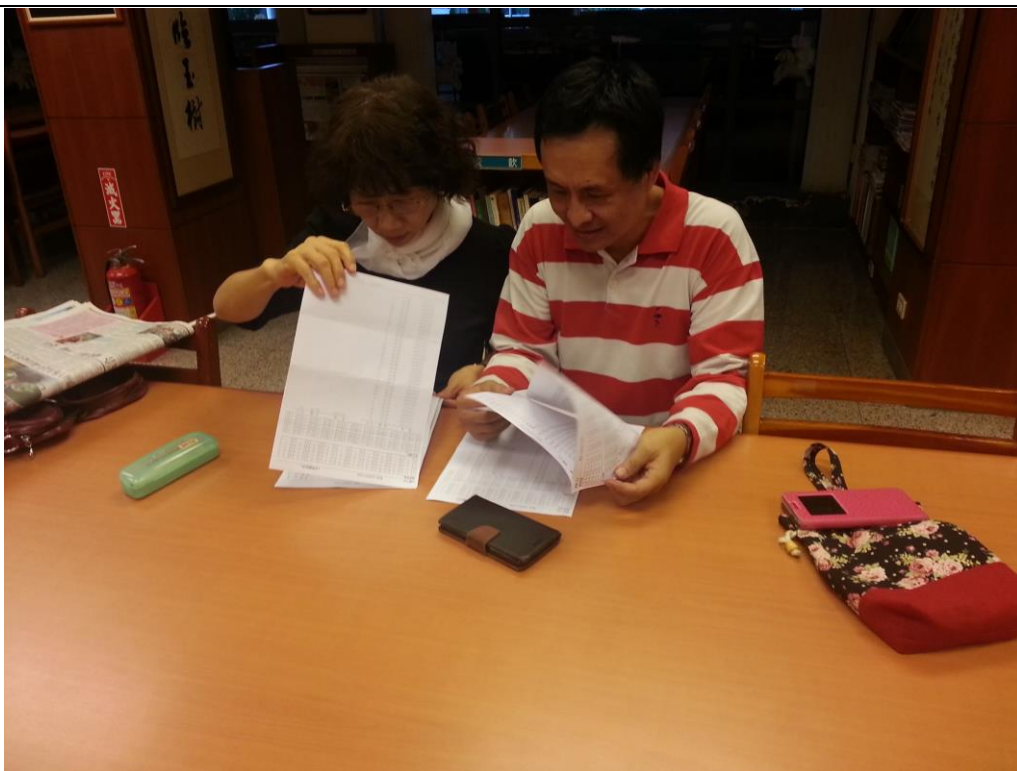
104年8月19日 照片說明：公民科共同備課