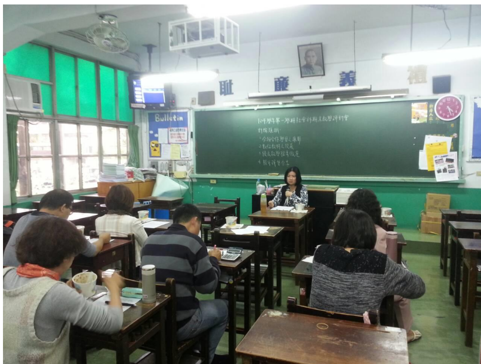
105年1月14日 照片說明：科主席主持會議