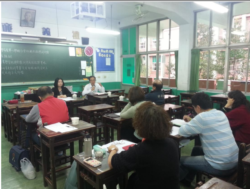
105年2月17日 照片說明：教務主任參與會議討論