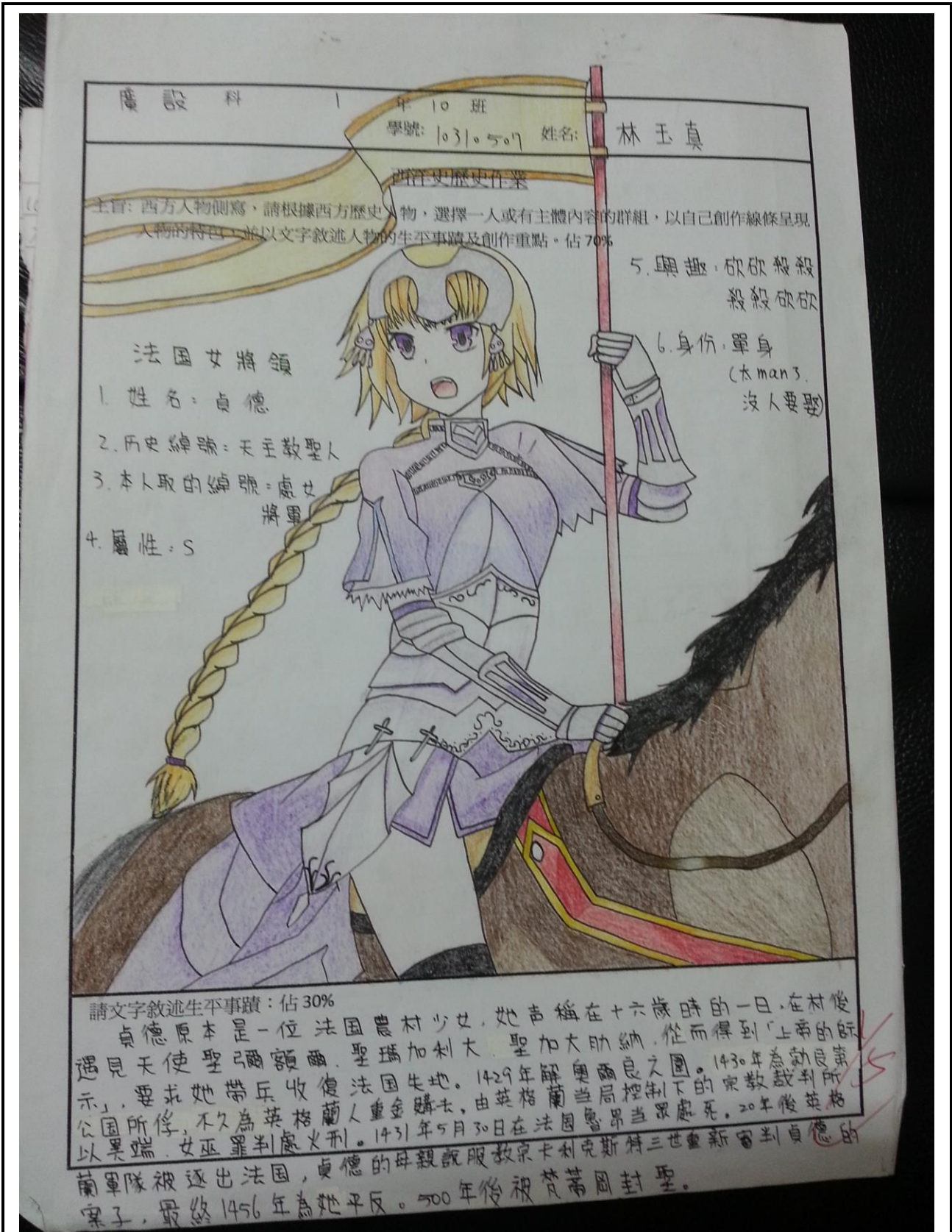
照片說明: 歷史人物主題介紹