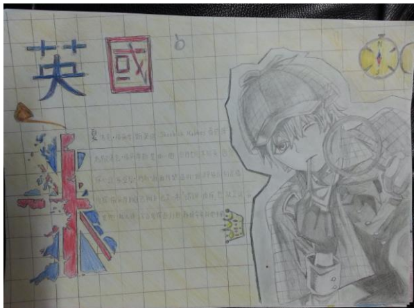
想像地圖：英國福爾摩斯