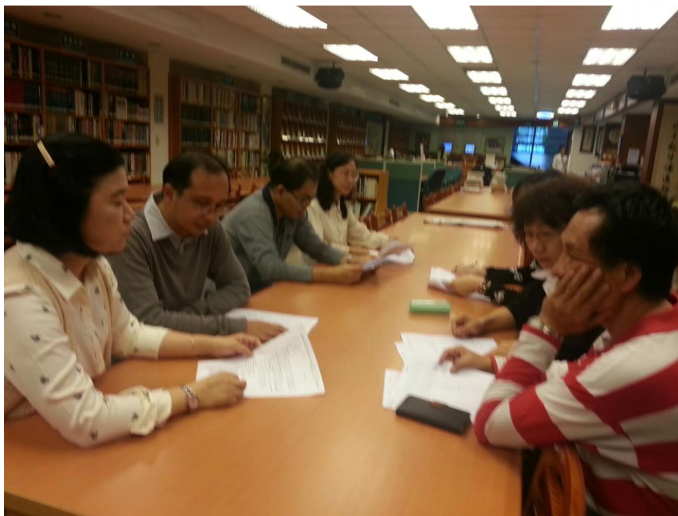
104年11月30日 照片說明：針對學習共同體內容討論