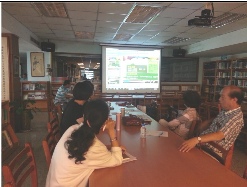
104年8月18日 照片說明：地理科數位教材分享