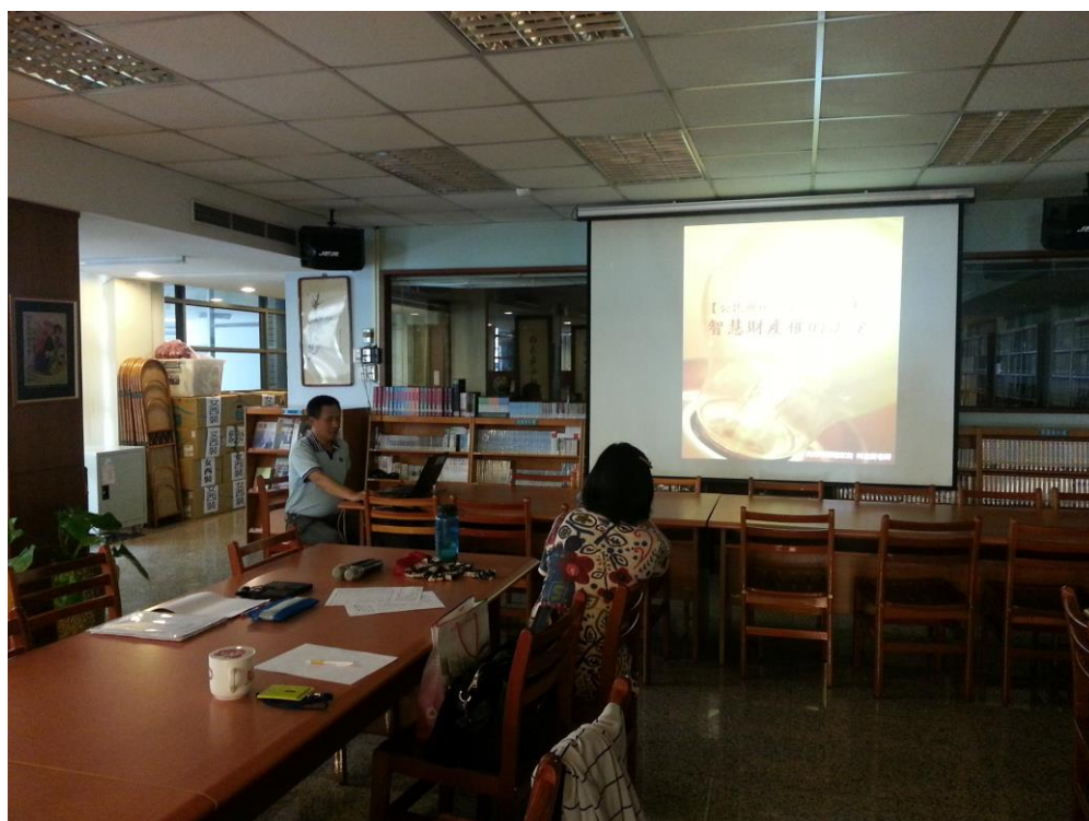
104年8月18日 照片說明：公民科數位教材分享