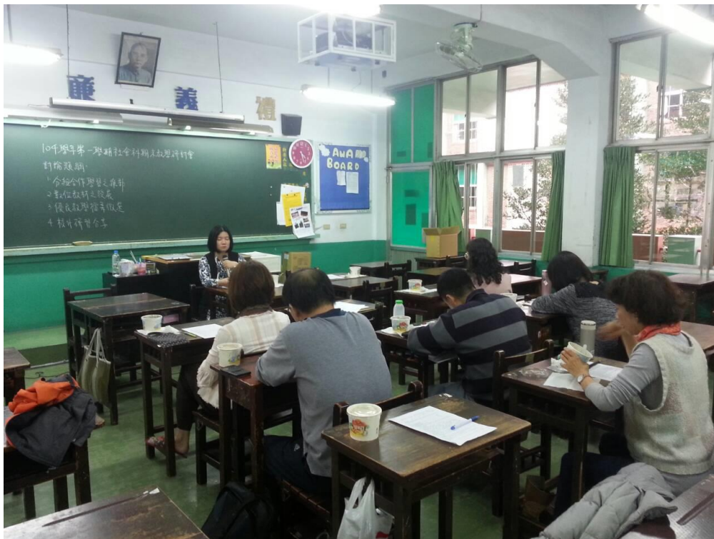
105年1月14日 照片說明：科主席主持會議