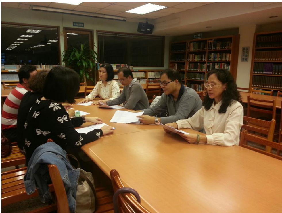
104年11月30日 照片說明：針對學習共同體內容討論