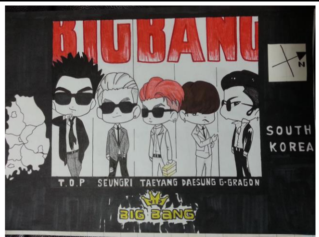
想像地圖：南韓偶像團體