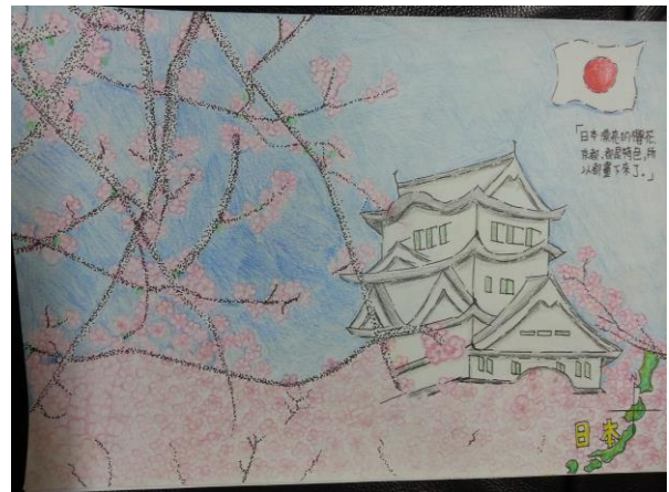
想像地圖：日本櫻花