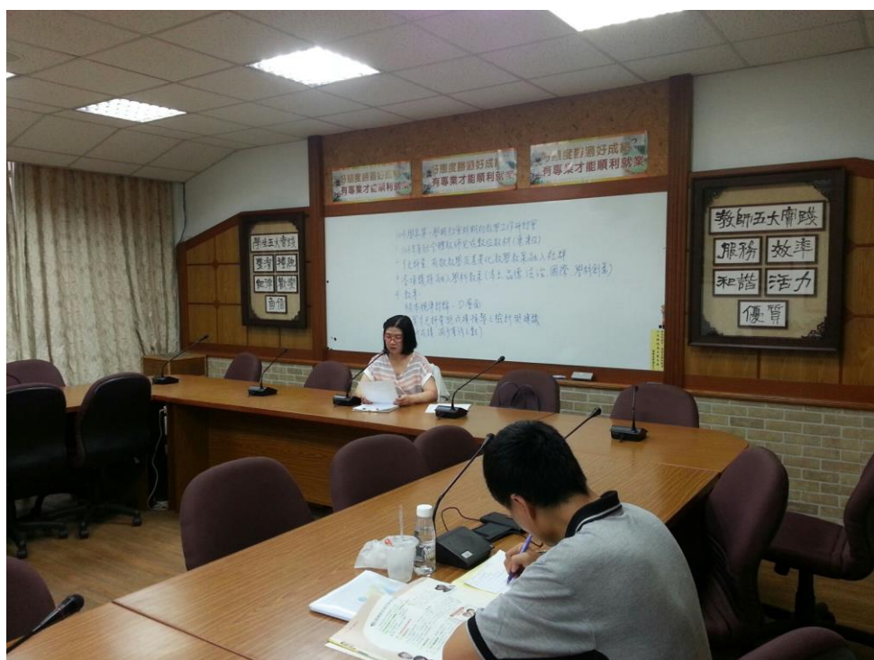
104年8月19日 照片說明：科主席宣讀討論題綱