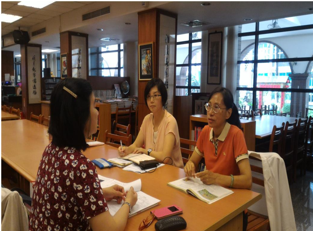
104年8月19日 照片說明：歷史科共同備課