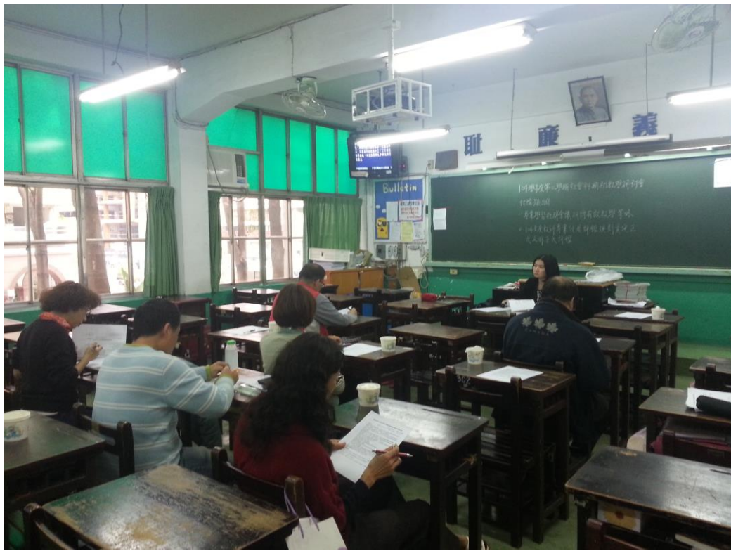
105年2月17日 照片說明：科主席主持會議