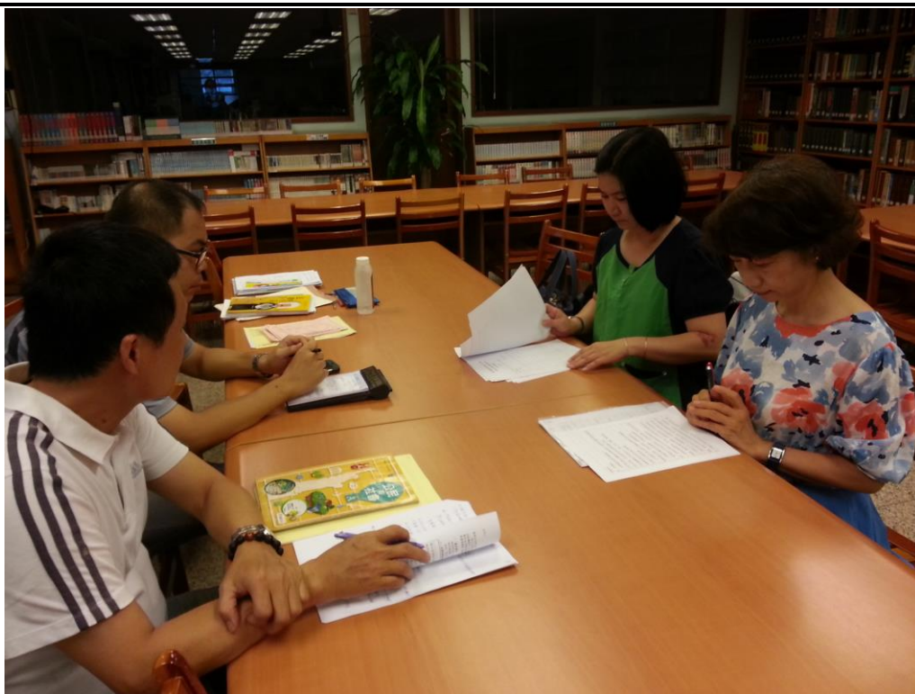
104年8月21日 照片說明：差異化教學討論