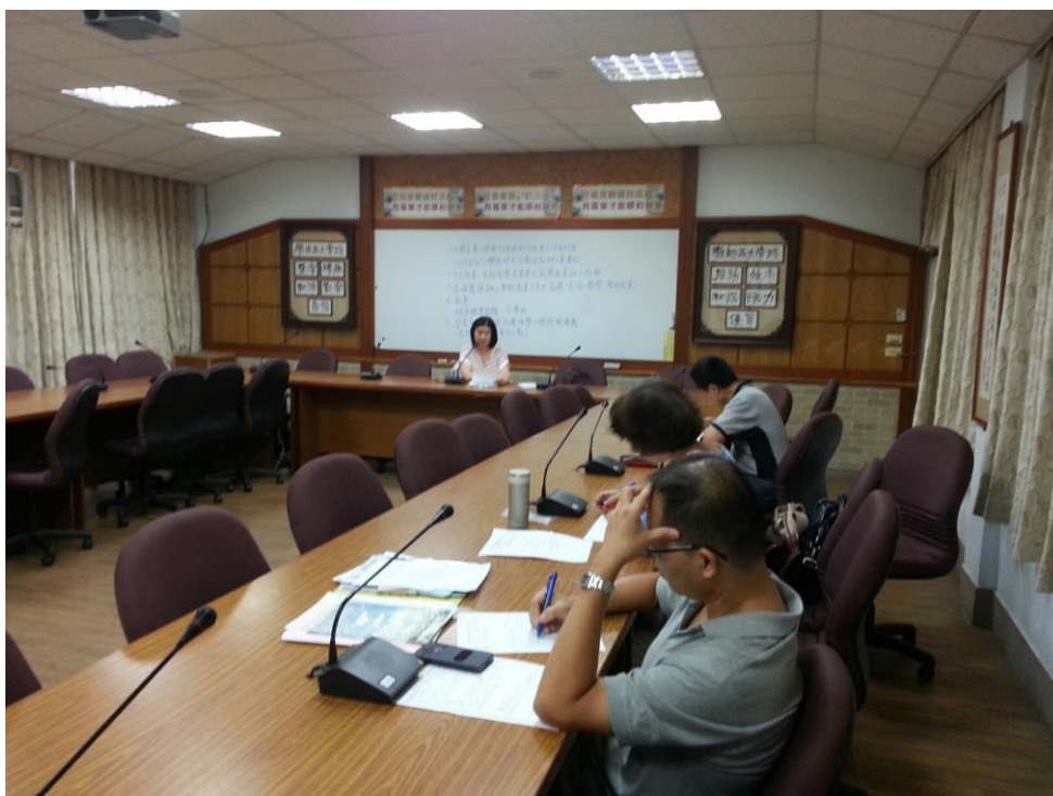
104年8月19日 照片說明：科主席主持會議