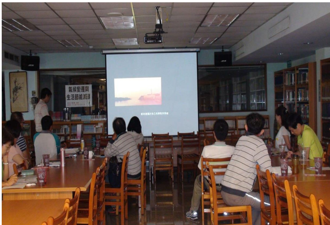
104年8月20日 照片說明：教授演講